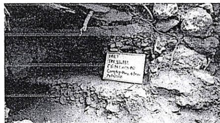
Figura 9. Pozo de sondeo donde se aprecian varios pisos estucados.