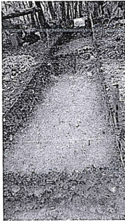
Figura 3. Plataforma B1, relleno de construcción colapso expuesto.