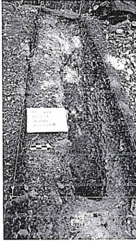
Figura 6. Operación 341-C-1