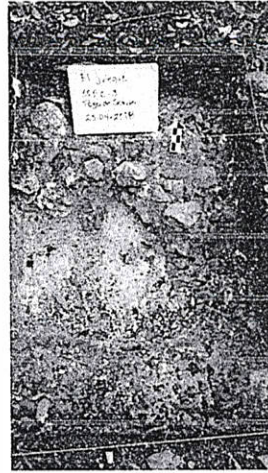
Figura 7. Operación 500C-3.