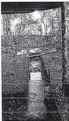
Figura 5. Operación 340E-7 Estructura Oeste.