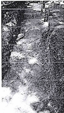
Figura 4. Cima de Plataforma, corredor entre estructura A1 y A3.