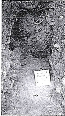
Figura 10. Op. 100SH saqueo esquina SO Trádico.