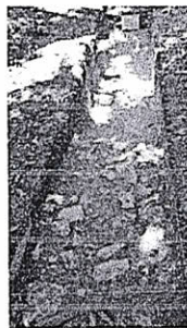
Figura 2. Cima de la Plataforma Colapso estructural y piso destruido.