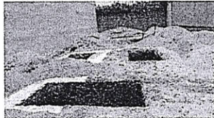
Figura 1. Área de excavación del Proyecto de Rescate Callejón el Burrito.