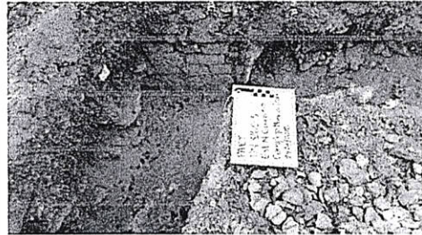
Figura 8. Jamba de la estructura Norte, grupo 152, operación 326C-3.